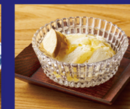
クリームチーズ豆腐 & 赤酒漬けチーズ ¥500 (唐辛子はちみつ掛け)