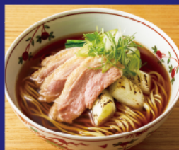
しっとり鴨ローストの 醤油スープ麺 ¥2,200