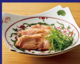
しっとり鴨ロースト ¥700