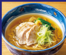
蒸し鶏とねぎの やさしい塩スープ麺 ¥1,800