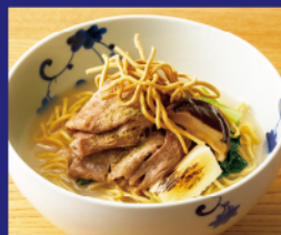
黒毛和牛しゃぶしゃぶの 華味烏白湯麺 ¥2,300