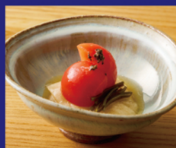
アメーラトマトと 季節野菜の浅漬け ¥600