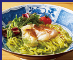
真鯛昆布締めと 抹茶の和え麺 ¥2,000