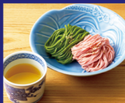
はしづめ製麺 本日の2色のつけ麺 ¥1,300 (塩or醤油) *写真の麺は一例です。