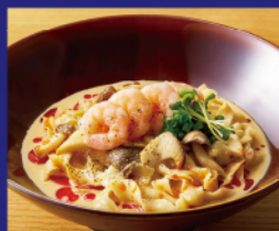
海老とキノコの 辣油クリーム和え麺 ¥1,800