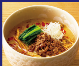
粗挽き肉味噌の 担々麺 ¥1,800